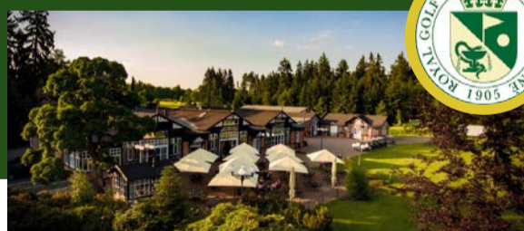
ROYAL GOLF CLUB MARIÁNSKÉ LÁZNĚ www.golfml.cz