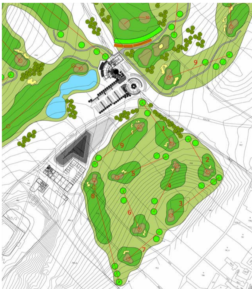
Plán devítky od Jonathana Davisona