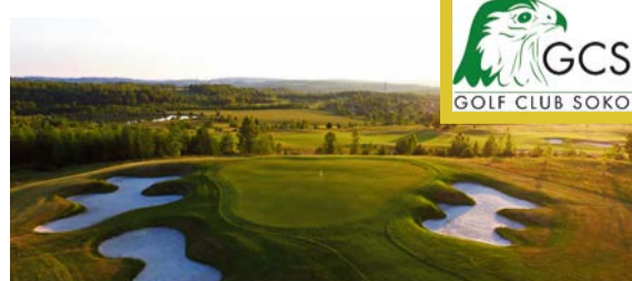
GOLF SOKOLOV www.golf-sokolov.cz