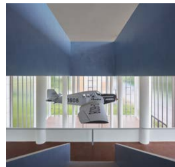
Památník Tomáše Bati ve Zlíně

tura, bydlení v baťovských domcích v zahradách, technické památky a unikáty, zlínský film nebo místa, kde si v kulisách funkcionalistických staveb můžete dát něco dobrého. PR