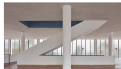
Památník Tomáše Bati ve Zlíně

Kdybyste ho hledali na mapě, museli byste prstem objet nejen Zlín a jeho blízké okolí, ale také Otrokovice, Napajedla, Sezimovo Ústí, Třebíč, slovenské Partizánske, indonéskou Kalibatu i kanadskou Batawu. Tady totiž Tomáš Baťa a později jeho bratr