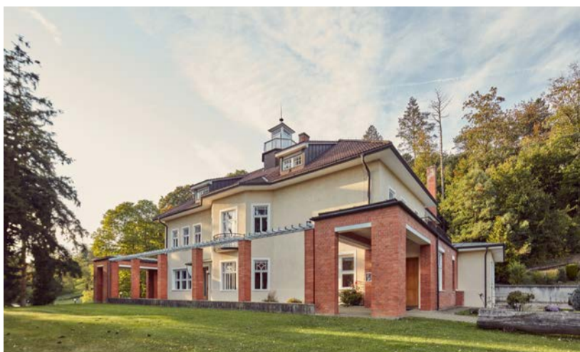
Vila Tomáše Bati ve Zlíně

Podle zlínského vzoru postavil podnikatel Tomáš Baťa a jeho pokračovatelé města po celém světě. Vybudovali impérium, které zaměstnávalo více než 40 000 lidí. Nyní všechna tato baťovská místa představuje projekt Baťův region.