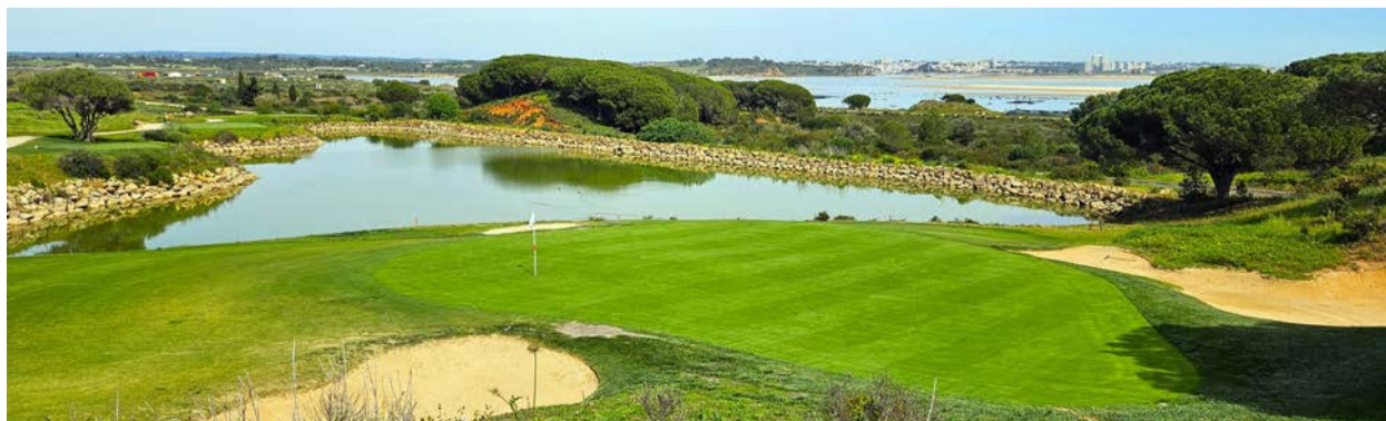
Palmares GC, 12. jamka par 3 hraný přes vodní plochu