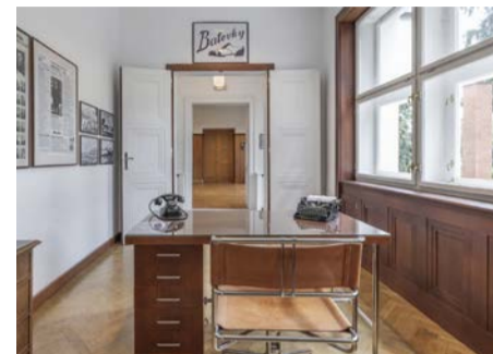
Vila Tomáše Bati ve Zlíně