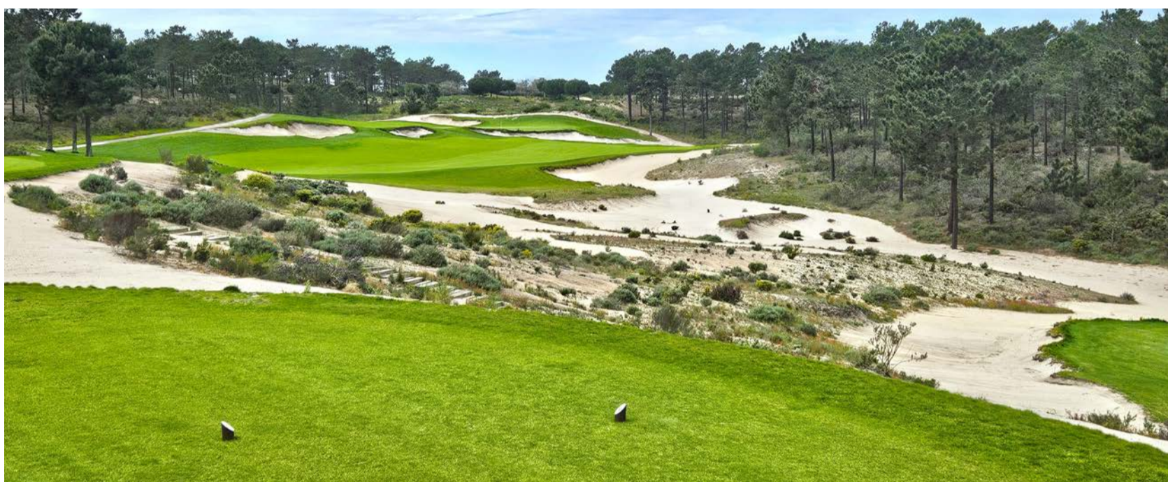
Terras da Comporta, hřiště Dunas, které se ihned po otevření dostalo do TOP 10 v kontinentální Evropě

Comporta přetahuje o pozici golfové jedničky Portugalska. Hřiště se rozprostírá v kopcích poblíž hranic se Španělskem. Doporučujeme zavítat na skvěle vybavený driving range a také si vzít buggy. Hřiště je totiž rozlehlé a má dlouhé přechody. Pastvu pro oči znamená zejména okolí greenů, chráněných obřími bunkery. Fairwaye se vinou mezi pestře kvetoucími loukami.