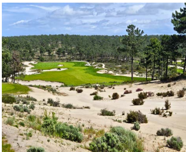
Terras da Comporta, hřiště Dunas a 13. jamka

v ptačí rezervaci. Devítka, ležící celá v rovině, je roztažena mezi několika jezer a má dokonalou osmou jamku s ostrovním greenem. Jen pár minut jízdy odtud najdete ještě San Lorenzo . Hřiště s dvěma odlišnými devítkami dlouho patřilo mezi evropských Top 100. Z greenu pětky a dalších dvou jamek máte nádherné výhledy na Atlantik. Na druhé devítce zaujmou poslední dvě jamky. Čtyřparová osmnáctka sousedí s rozsáhlou lagunou, její fairway se dvakrát lomí a po obou stranách číhá voda.