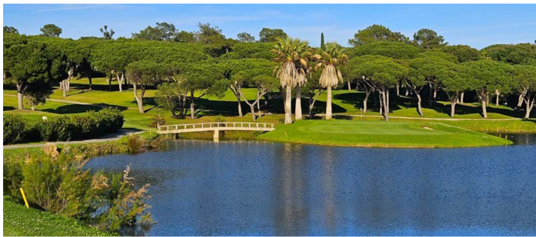
Ostrovni green na Pinheiros Altos, osmá jamka