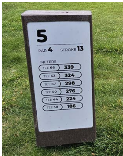
Ze žlutých je to často úměrné. Co takhle týčka jako v Portugalsku?

jící délka hřiště (vizte tabulku). Pokud nevíte, jak daleko pálíte, jsou i tabulky podle délky ran pětikou nebo sedmičkou železem.