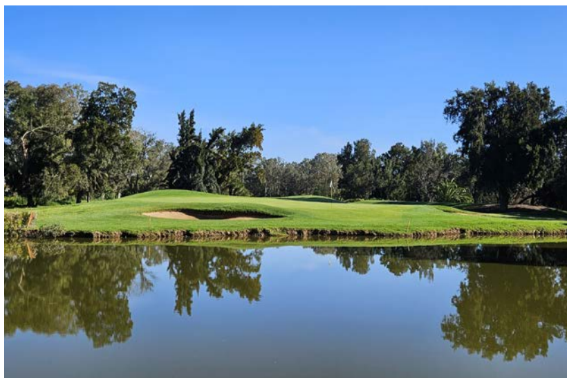
Penina Hotel & Golf Resort a 12. green