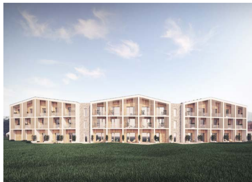
Studie hotelu Marshall

V areálu funguje hotel, restaurace, bikepark, bobová dráha, trampolíny, lanové centrum, lukostřelba, rodeo s býkem i vodní nádrž s pláží. A v létě přibude golf!