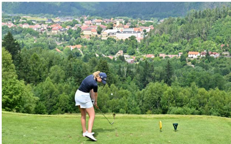
LETAS se letos vrací na Panoramu Kácov

Polovina června je podle něho pro turnaj LETAS ideální, protože akce nekoliduje s ničím významným pro amatérky v Evropě a k tomu jsou už zpět v Česku hráč-