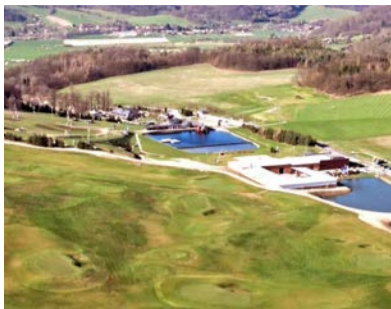
Jamky v Tošovicích

Ve velkorysém všesportovním Heiparku Tošovice má rodina Heinů velké plány. V létě by se měla otevřít veřejná devítijamková akademie, příští rok by mohla začít výstavba mistrovské devítky a v budoucnu by se k ní mohla přidat druhá.