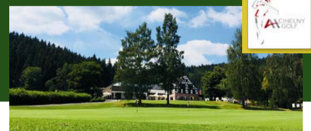
CIHELNY GOLF & WELLNESS RESORT www.axxshotels.com/cs/golf-cihelny