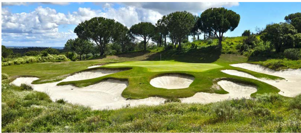
Monte Rei GC. Devátá jamka je dokonale chráněný třípar