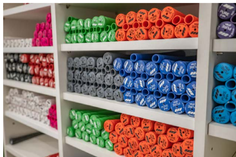
Gripy připraveny pro každého