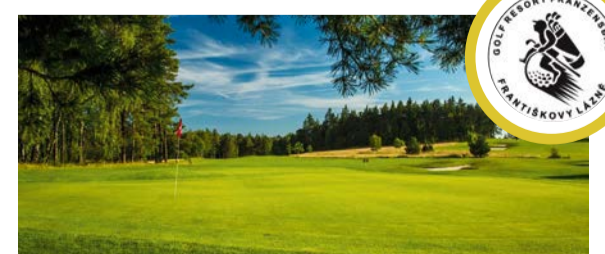
GOLF RESORT FRANZESBAD – HAZLOV www.gr-fl.cz