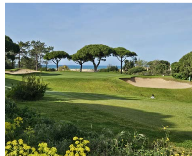
Z krátkého paru 3 od páté jamky San Lorenzo GC se otevírá výhled na Atlantik