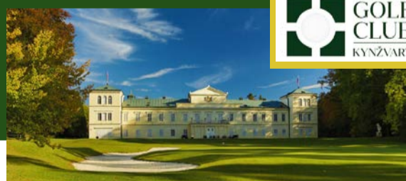
GOLF CLUB KYNŽVART www.golfkynzvalt.cz