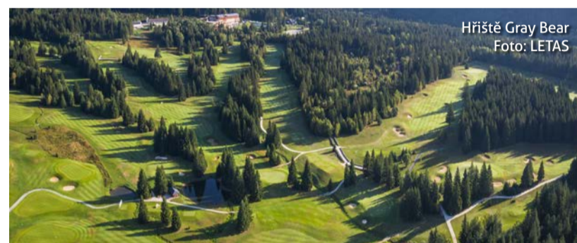
Hřístě Gray Bear