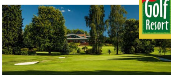
GOLF RESORT KARLOVY VARY www.golfresort.cz